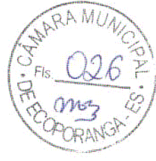
ELIAS DAL' COL Prefeito Municipal

Rua Suelon Dias Mendonça, nº 20, Centro – Ecoporanga – Estado do Espírito Santo CEP 29.850.000 – Telefone: (27) 3755-2900/3755-2915